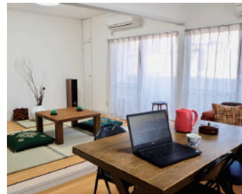
5F コミュニティールーム